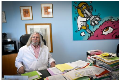
Didier Raoult, le 26 février, à Marseille.

PAR PASCALE PASCARIELLO ARTICLE PUBLIÉ LE MERCREDI 8 AVRIL 2020