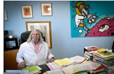
Didier Raoult, le 26 février, à Marseille.

résultats biaisés, des méthodes peu scrupuleuses et une opacité dans les financements des travaux nourrissent le dossier de ses contempteurs.