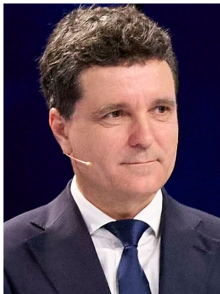
Nicușor Dan en 2025.