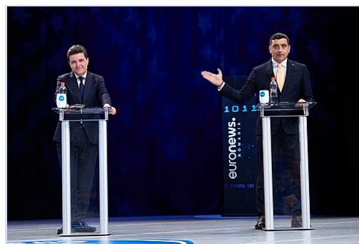
Dan lors d'un débat présidentiel avec George Simion , le 8 mai 2025.

Lors du deuxième tour, Nicușor Dan est élu avec 53 % des voix 17, 18 . Il est le deuxième maire de la capitale, après Traian Băsescu , élu président.