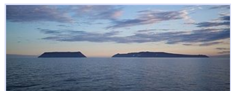
La Petite Diomède (États-Unis, à gauche) et la Grande Diomède (Union soviétique puis Russie, à droite) : la frontière du « rideau de glace ».