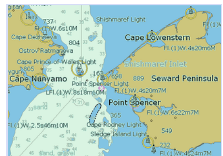
Plan nautique du détroit.